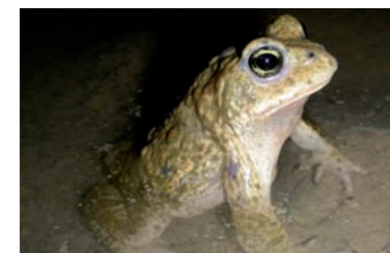
Création de surfaces d'eaux pour le maintien du Crapaud Calamite dans le Haut-Rhin.

Pour Holcim Granulats (France), les enjeux environnementaux sont primordiaux. L'évolution des attentes sociétales dans ce domaine nous amène à intégrer la gestion des nuisances et les impacts dans l'exploitation de nos sites. Pour ce faire, nous engageons des partenariats avec les acteurs locaux (associations, riverains...) pour être en harmonie avec l'environnement ainsi que la vie sociale et culturelle locale.