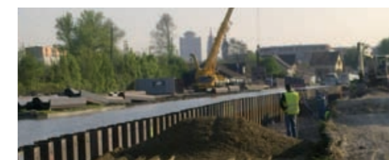
Fourniture de grave naturelle du Rhin de type D31.