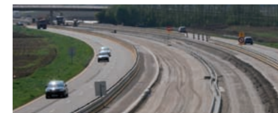
Fourniture de grave naturelle du Rhin de type D3.