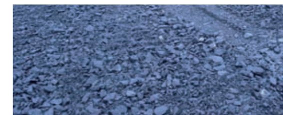
Livraison de 35 000 tonnes de granulats calcaires.